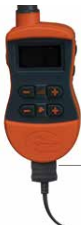
ANSCHLUSSTECKER WIRD AM LADEANSCHLUSS DES HANDSENDERS ANGEBRACHT

Anmerkung: Die ungefähre Batterielebensdauer zwischen den Ladevorgängen beträgt 50 bis 70 Stunden, je nach Häufigkeit der Verwendung.